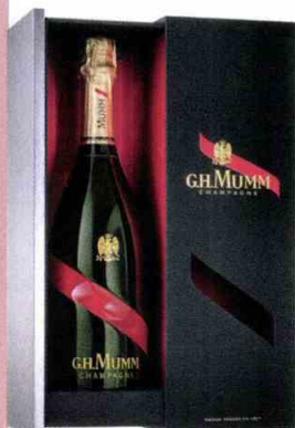
Coffret contenant une bouteille de champagne Mumm Grand Cordon, 49,50 €, édition limitée, G.H. Mumm. www.drinksandco.fr