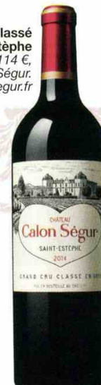
Grand cru classé de Saint-Estèphe 2014, 114 €, Château Calon-Ségur. www.calon-segur.fr