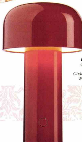
Lampe de table Bellhop rechargeable, design Edward Barber & Jay Osgerby, en vente à The Conran Shop, 195 €, Flos. www.conranshop.fr