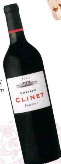
Pomerol 2012, 110 €, Château Clinet. www.chateauclinnet.com