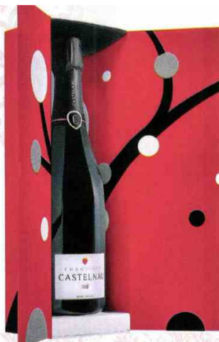
Champagne cuvée Brut Rosé dans son coffret, 44,70 €, Champagne Castelnau. www.champagne-castelnau.fr