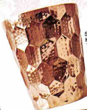
Seau à champagne Hex Bucket, designer Tom Dixon, finition cuivre, 258 €, Silvera. www.silvera.fr