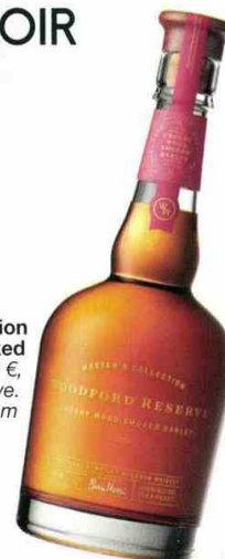
Master's Collection Cherry Wood Smoked Barley, 99 €, Woodford Reserve. fr.woodfordreserve.com