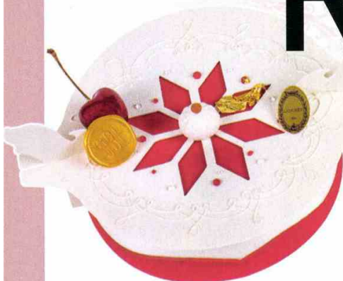
Bûche Tine , création Sverre Saetre, ganache façon riz au lait, compotée de griottes et épices, mousse à la rose, dacquoise amande, croustillant de noix de macadamia, disponible à partir du 19 décembre 2018, 6/8 personnes, 68 €, Ladurée. www.laduree.fr