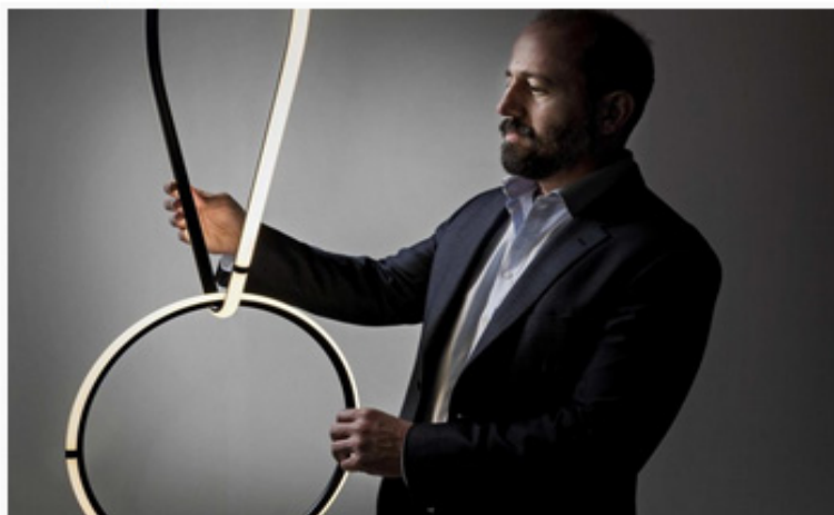
Michael Anastassiades © Flos

L'exposition propose aussi un court-métrage, Michael , réalisé par Leone Balduzzi, qui raconte l'histoire de Michael Anastassiades. Le designer chypriote est considéré comme l'un des plus talentueux de notre époque. Il travaille avec Flos depuis 2013. Forts d'un succès international, ses designs de nature poétique se combinent à une technologie innovante d'éclairage. Jewels after Jewels after Jewels est l'une de ses plus spectaculaires installations.