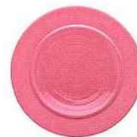
En haut La collection « Bahia », une nouveauté chez Degrenne qui a trouvé sa place dans la famille « Artisanal nature ». « PHILIPPE STARCK Ci-dessus L'assiette gourmet ronde petit bassin en coloris vert argile et l'assiette plate en coloris rose sable de la collection « Bahia ». « MICHAEL COUCHARD