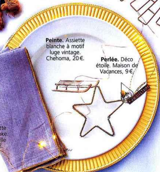
Peinte. Assiette blanche à motif luge vintage. Chehoma, 20 €.