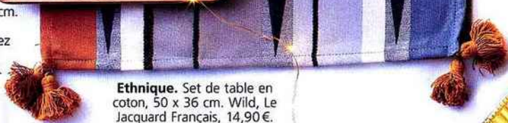
Ethnique. Set de table en coton, 50 x 36 cm. Wild, Le Jacquard Français, 14,90 €.