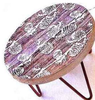
Surélevé. Plateau en bois gravé sur pieds, Ø 20 cm. Delamaison, 8,90 €.

Sertie. Serviette en lin, col. Smoke. Filo, Borgo Delle Tovaglie, 10 €.